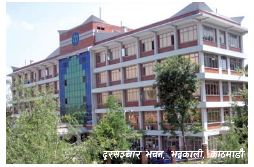
दूरसञ्चार भवन, भद्रकाली, काठमाडौं

नेपाल दूरसञ्चार कं. लि., केन्द्रीय कार्यालय, सूचना तथा प्रकाशन शाखाद्वारा प्रकाशित