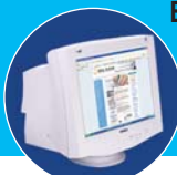
E-mail / Internet